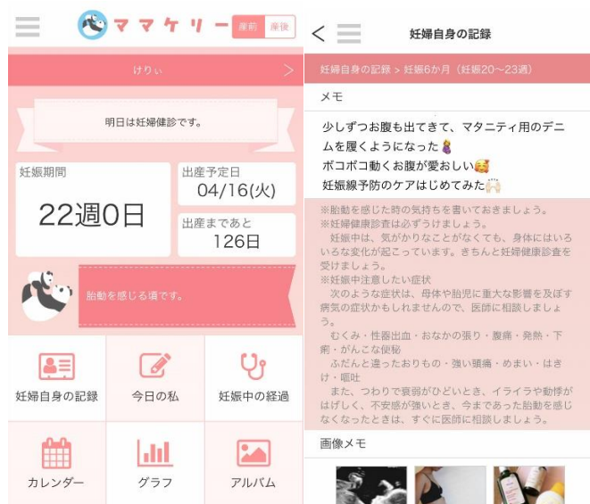
ママケリー画面イメージ

妊活・妊娠・出産・育児の記録をひとつのアプリで簡単に管理することができます。選べる切替モード(妊活・産前・産後)でアプリを入れ替えることなく、ずっとこのアプリ1つで大丈夫です。いくつもアプリをインストールする必要がありません。